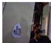
La soirée Rue Muller" by Nescafé le 10 mars 2011