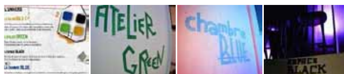
4 espaces principaux au sein de la Maison Ephémère de Nescafé La soirée Rue Muller" by Nescafé le 10 mars 2011 La soirée Rue Muller" by Nescafé le 10 mars 2011 La soirée Rue Muller" by Nescafé le 10 mars 2011